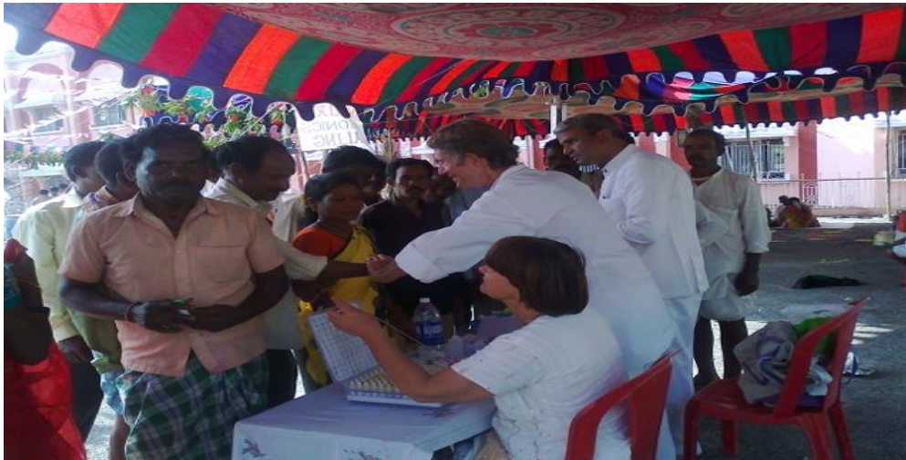
Medical Camp 21-23 November 2012 at PN Bahnsation, Puttaparthi